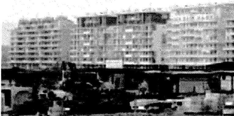
NEL MIRINO Il cantiere di Santa Giulia. I pm indagano sui prezzi troppo elevati chiesti per lo smaltimento dei rifiuti speciali che avveniva in Germania

L'investimento totale nel complesso immobiliare è di 2,8 miliardi di euro